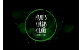
Mandi's Kürbiskernöl Schwarzenbach, NÖ