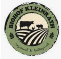
Wurst- & Fleischwaren biohof-kleinrath.at Bromberg/Schlatten, NÖ