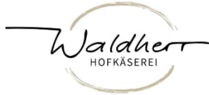
Streich- & Schnittkäse Kühbach/Lichtenegg, NÖ